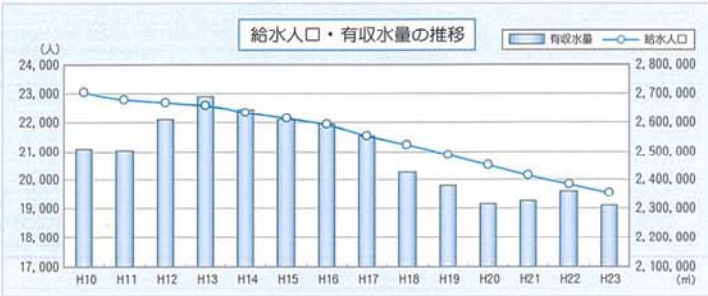
※有収水量…料金徴収の対象となった水量(メータによる実使用水量)

2. 尾花沢市・大石田町の国勢調査人口は、平成17年の29,519人から平成22年の27,115人へと減少しております。給水人口の減少及び少子高齢化に伴う水需要の低迷による料金収入の減少は今後も続き、経営基盤の脆弱化が一層進行するものと考えられます。